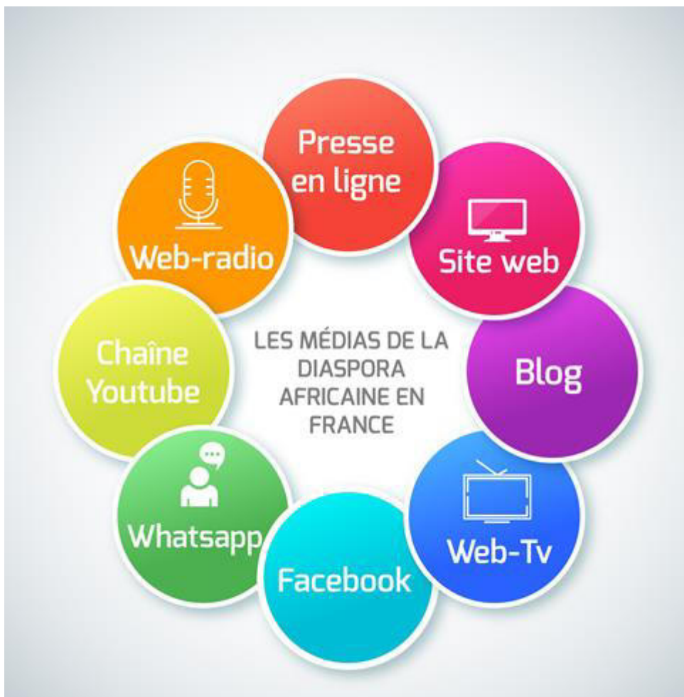
Fig. 1 : Mapping des médias diasporiques africains en France

Au total huit types différents de médias numériques ont été dégagés à travers notre base de données. Il s'agit de la presse en ligne, des blogs, des sites Web (sites d'information) des organisations associatives et autres, des Webradios, des Web-télévisions, des chaînes de télévision sur YouTube, des pages/comptes Facebook et des groupes WhatsApp. La figure suivante donne à voir la cartographie de ces médias.